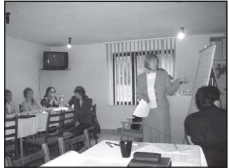
Práca v skupinách