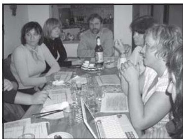
Pracovné stretnutie s českým partnerom

Verejno - súkromné partnerstvo Muránska planina v septembri 2007 v obci Nepolisy podpísala partnerskú zmluvu o spolupráci s českým partnerom MAS Společná Cidlina.