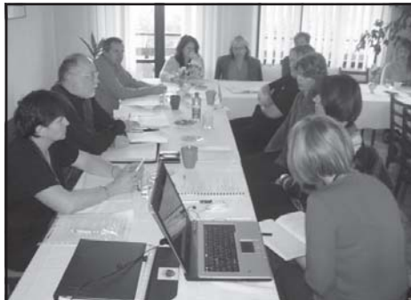
Pracovný workshop v Muráni

zložená zo zástupcov samosprávy pocítovala nedostatok vyčlenených finančných zdrojov na opatrenia 4.1. a 4.2. a obmedzenie investičných zámerov. Pracovná skupina zložená zo zástupcov MVO ( a školstvo, DSS, ...) bola sklamaná z nedostatočného priestoru v prístupe Leader (len vzdelávacie aktivity, marketing) a množstva obmedzení. Pracovná skupina zložená zo zástupcov SHR, FO a FO v CR bola sklamaná z obmedzení a celkových zmien. Očakávali zameranie prístupu Leader v zmysle pôvodných, prvotných prezentácií z roku 2005. Napriek sklamaniam a