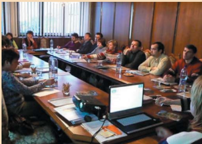
Zasadnutie rady VSP MP v Pohronskej Polhore