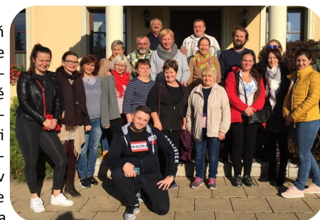
Účastníci študijnej cesty na Moravu

Kancelária MAS zároveň neustále monitoruje možnosti získania finančných zdrojov na vlastné projekty, projekty spolupráce alebo aj možnosti získania finančných zdrojov pre svojich členov a partnerov (napr. zdroje BBSK, ŠOP SR, OOCR a pod). Všetky naše kapacity