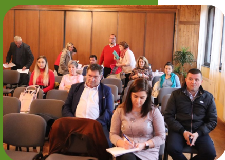
Valné zhromaždenie MAS