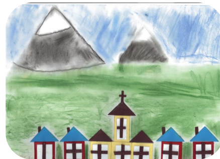
Historické a kultúrne pamiatky (7 - 10 rokov) „Dedinka Michalová“