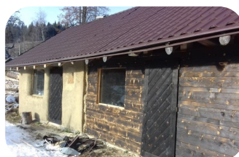
Šopisko—výstavba stajní pre kone putujúce po regióne

V 4.Q.2019 sme sa zúčastňovali pracovných stretnutí k príprave rozšírenia značky regionálny produkt GEMER-MALOHONT na ubytovacie služby, stravovacie služby a zážitky zahŕňajúce doplnkové služby v cestovnom ruchu, animačné programy, tradičné podujatia a pod.