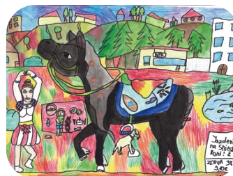
„Škola jazdenia v Tisovci“