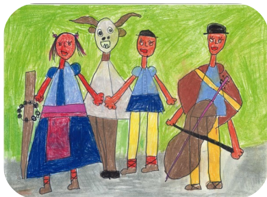
Podujatia územia (4 - 6 rokov) „Fašiangová veselica v Čiernom Balogu“