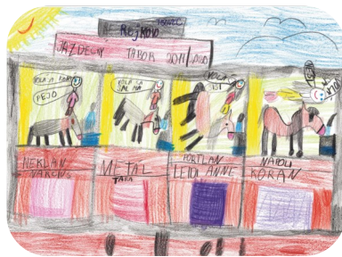
Podujatia územia (7 - 10 rokov) „Jazdecký tábor“