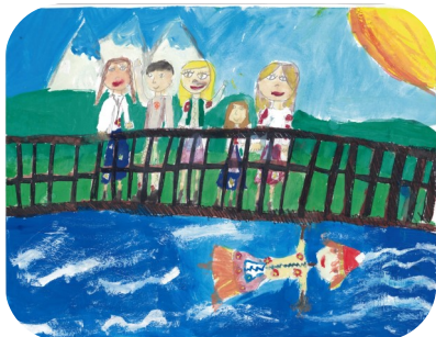
Zvyky a tradície (7 - 10 rokov) „Vynášanie Moreny v obci Valaská“