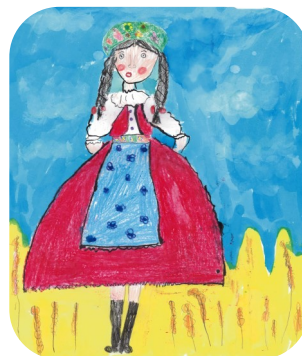
Zvyky a tradície (4 - 6 rokov) „Švárna Anička z Polhory“

Všetky výtvarné diela si môžete pozrieť pri príležitosti slávnostného odmeňovania výhercov II. ročníka výtvarnej súťaže „Krásy MAS očami detí“, ktoré sa uskutoční 27. januára 2020 o 16:00 hod. v priestoroch Galérie v Mestskom kultúrnom stredisku v Tisovci. Pripravený je bohatý program, o ktorý sa nám postarajú detičky z nášho územia a bude pripravené i drobné občerstvenie. Tešíme sa na Vašu účasť.