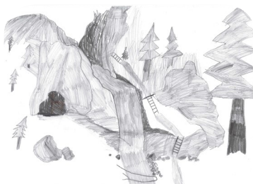
Príroda územia (7 - 10 rokov) „Vodopád v Čertovej doline“