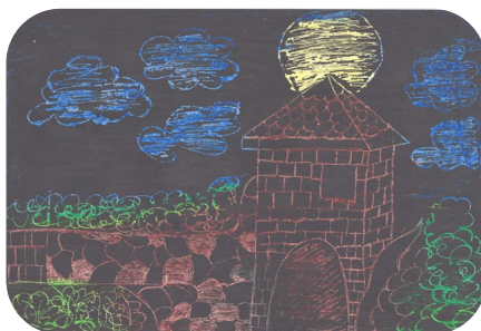
Historické a kultúrne pamiatky (4 - 6 rokov) „Muránsky hrad“