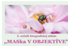
3. ročník fotografickej súťaže „MASka v objektíve“

Tak ako vo všetkých veciach aj pri fotografii sa často stane, že upadneme do stálych, zabehnutých koľají. Opakujeme námety a prístupy a možno sa začneme aj nudiť. Ale na tvorivej činnosti je krásne to, že sa stále môžeš zlepšovať, posúvať a učiť.