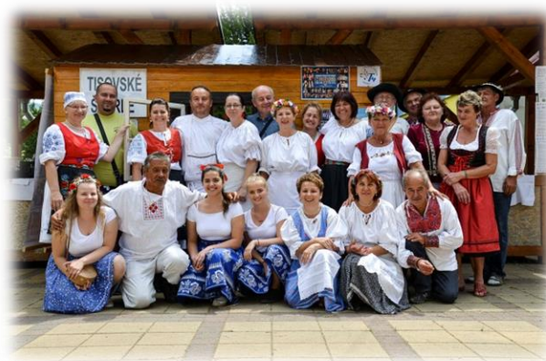
„ Trh regionálnych produktov“