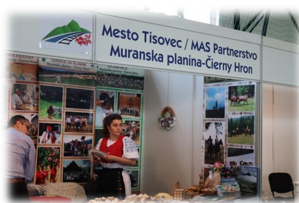
„Gemer Expo & Festival“