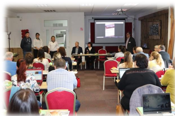
„Krajská konferencia rozvoja vidieka“