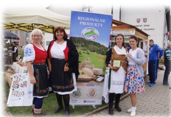
„ Michalské dni“