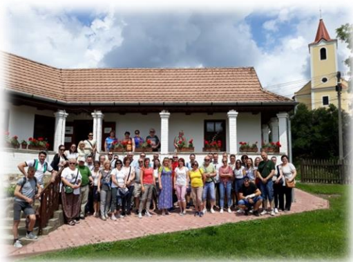
„Exkurzia – Hollóko, Maďarsko“