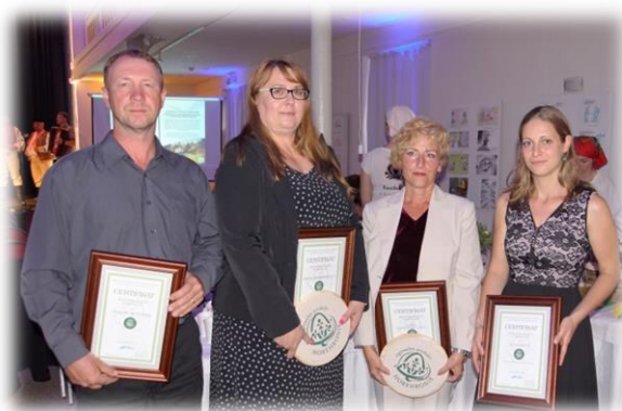
„Regionálna značka HOREHRONIE“