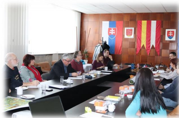
„Rada VIP BB kraja“