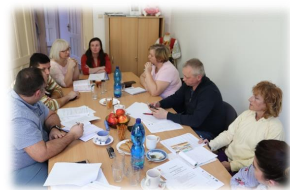
„Rada Partnerstva MP-ČH“