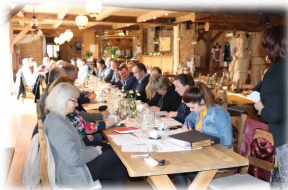
„Valné zhromaždenie Partnerstva MP-ČH“